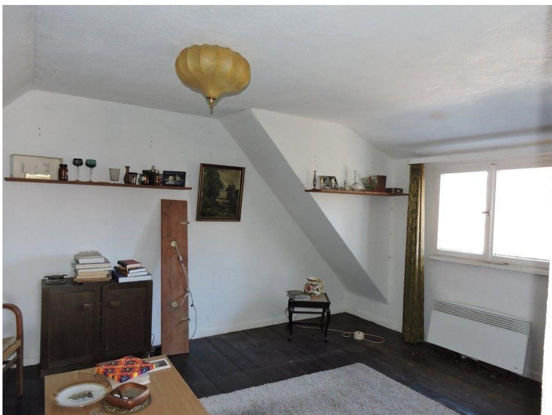
Zimmer 1. OG