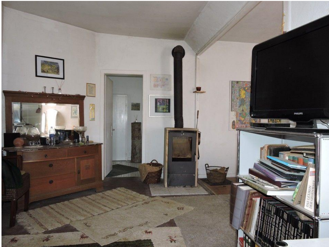
EG mit Ofen