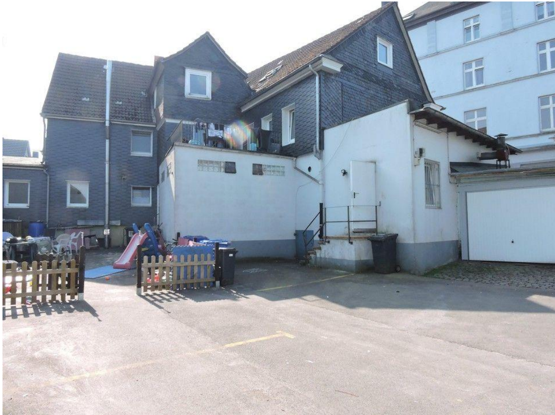
Ansicht von hinten